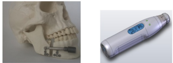
Fig. 2 : Distracteur magnétique et activateur externe

L'Unité de Mathématiques Appliquées est reconnue pour son expertise dans l'étude de problèmes inverses en lien avec la propagation d'ondes. Si l'étude des ondes sonores en milieu maritime a donné lieu à de nombreuses collaborations avec Naval Group, ces ondes sont aussi susceptibles de se déplacer dans des milieux biologiques complexes avec des enjeux importants dans le domaine de la santé et du diagnostic. Ainsi les travaux de l'enseignante-chercheuse Laure Giovangigli sur l'étude de problèmes inverses trouvent des applications directes sur les technologies d'imagerie médicale ultrasonores avec notamment une thèse menée récemment en collaboration avec le CMAP (École polytechnique) sur les corrections d'aberrations en échographie.